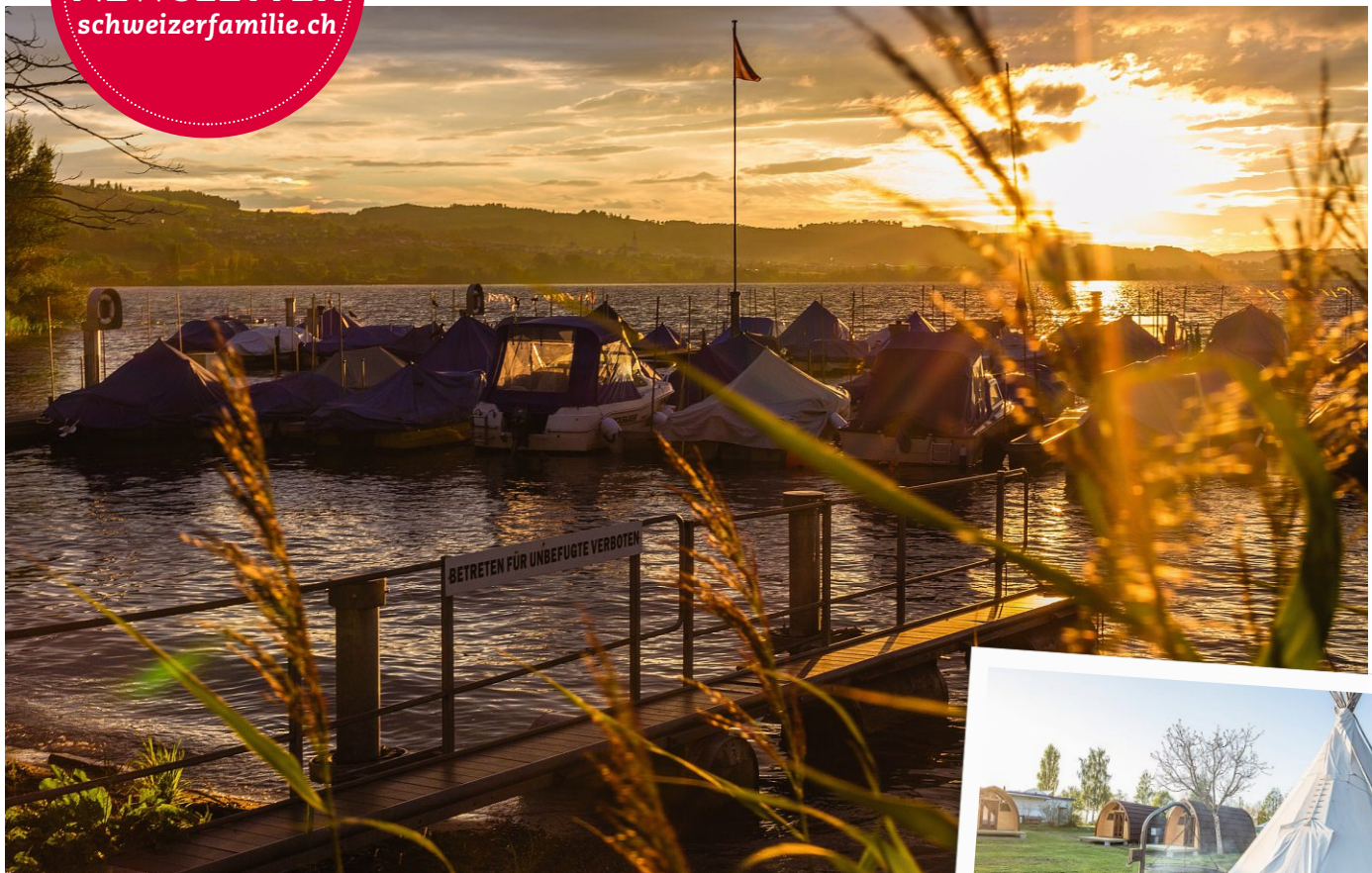
Der schönste Sonnenuntergang der Zentralschweiz? Am Sempachersee!