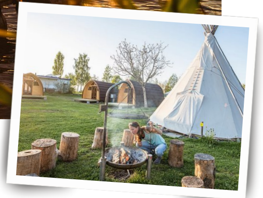
Typisch Glamping: Der Camping- platz bietet viele Annehmlichkeiten.

W o gibt es den schönsten Sonnenuntergang in der Zentralschweiz? Man munkelt: auf dem TCS-Campingplatz in Sempach. «Ein Glück, ist es der Unter- und nicht der Aufgang», flüstert meine 12-jährige Tochter mir zu. Stimmt, sonst hätten wir das Spektakel verpasst. Wir sind an diesem Morgen nämlich schon vor dem ersten Lichtstrahl unterwegs und müssen